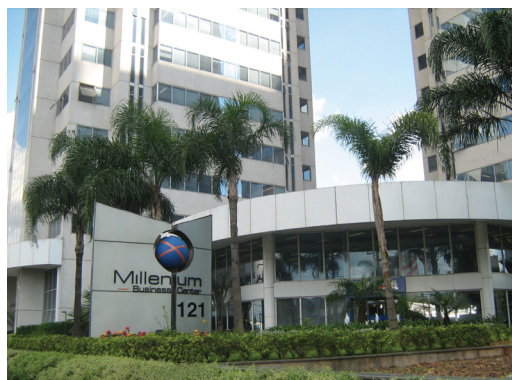
Sede da AFEAL, localizada na Barra Funda, em São Paulo

Desde a década de 1990, a associação constatou que era preciso atualizar o conhecimento dos empresários do setor. Ao mesmo tempo em que estimulou a certificação ISO 9001 junto às empresas associadas, promove anualmente viagens a feiras internacionais do setor, especialmente à MadeExpo, na Itália; Batmat, na França; e Veteco, na Espanha. No Brasil, além das visitas às fábricas, apóia e está presente em feiras especializadas,