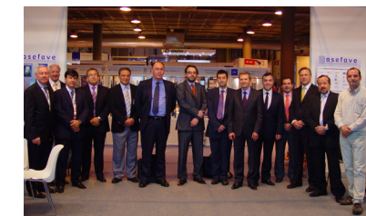
Representantes das associações em Madri

Entre as entidades que compõem o fórum, a AFEAL é a única que reúne somente fabricantes de esquadrias e fachadas de alumínio. As demais mantêm em seu quadro associados que produzem esquadrias de vários materiais - tema que estará na pauta dos debates.